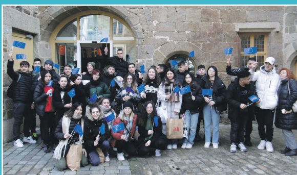
> Accueil de 50 étudiants italiens du lycée Sacré-Coeur de Saint-Brieuc