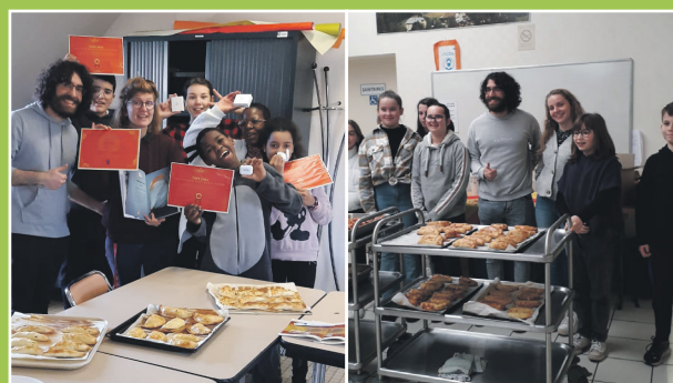
> Master chef à la MJC du Plateau & à la SIJ d'Yffiniac