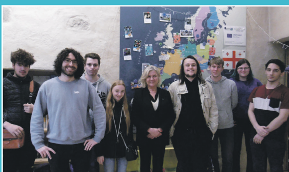
> Accueil de jeunes de la Mission Locale de Dinan