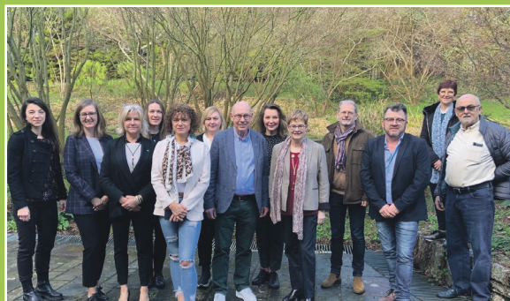
> Accueil de la délégation polonaise au Département dans le cadre du projet Erasmus Culture Verte avec Rich'ess et le Centre Franco Polonais